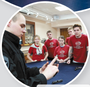
День ДОСААФ (февраль 2018 г.)