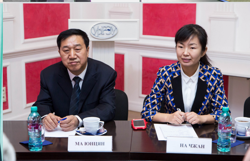
Визит китайской делегации Харбинского университета коммерции