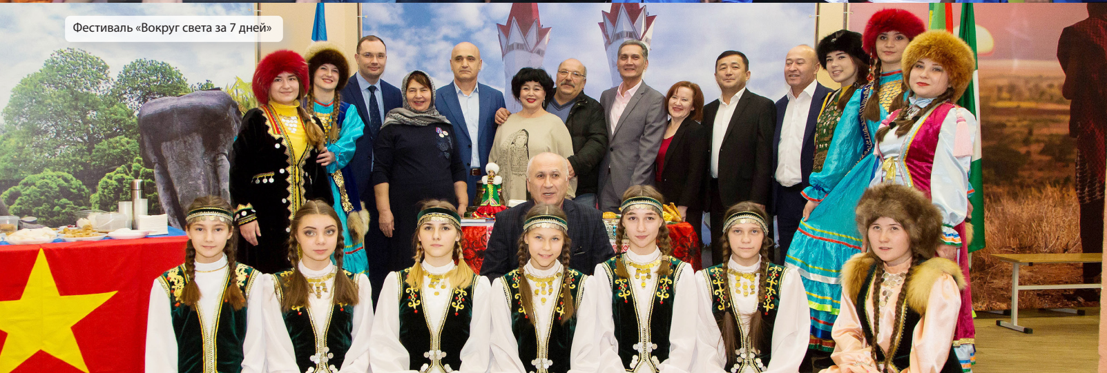
Фестиваль «Вокруг света за 7 дней»