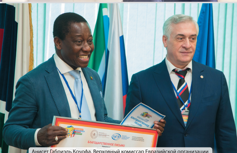
Анисет Габриэль Кочофа, Верховный комиссар Евразийской организации экономического сотрудничества по международному партнерству