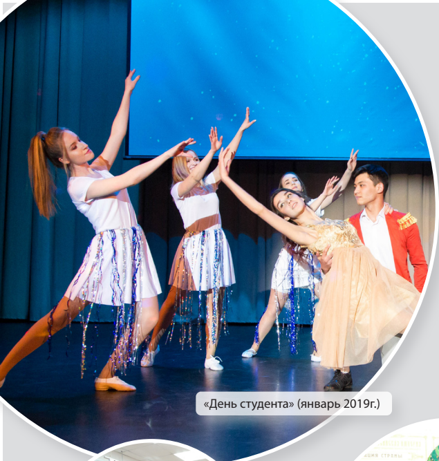
«День студента» (январь 2019г.)