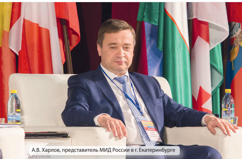
А.В. Харлов, представитель МИД России в г. Екатеринбурге