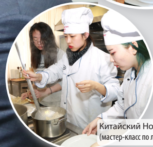
Китайский Новый год (мастер-класс по лепке пельменей)