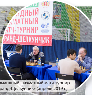
Командный шахматный матч-турнир «Гранд-Щелкунчик» (апрель 2019 г.)