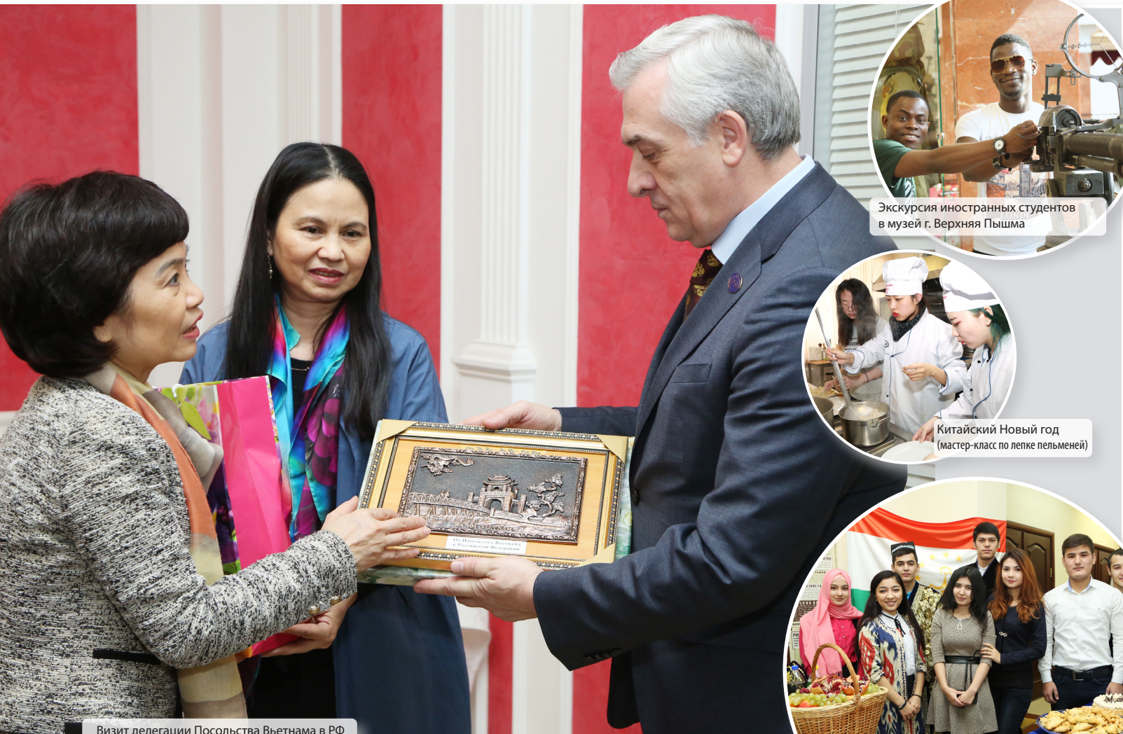
Визит делегации Посольства Вьетнама в РФ