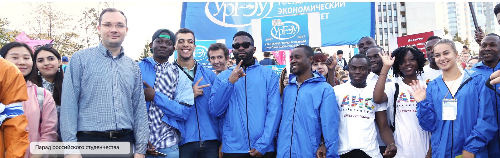
Парад российского студенчества