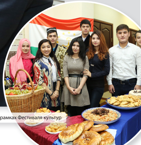
Выставка народов мира в рамках Фестиваля культур