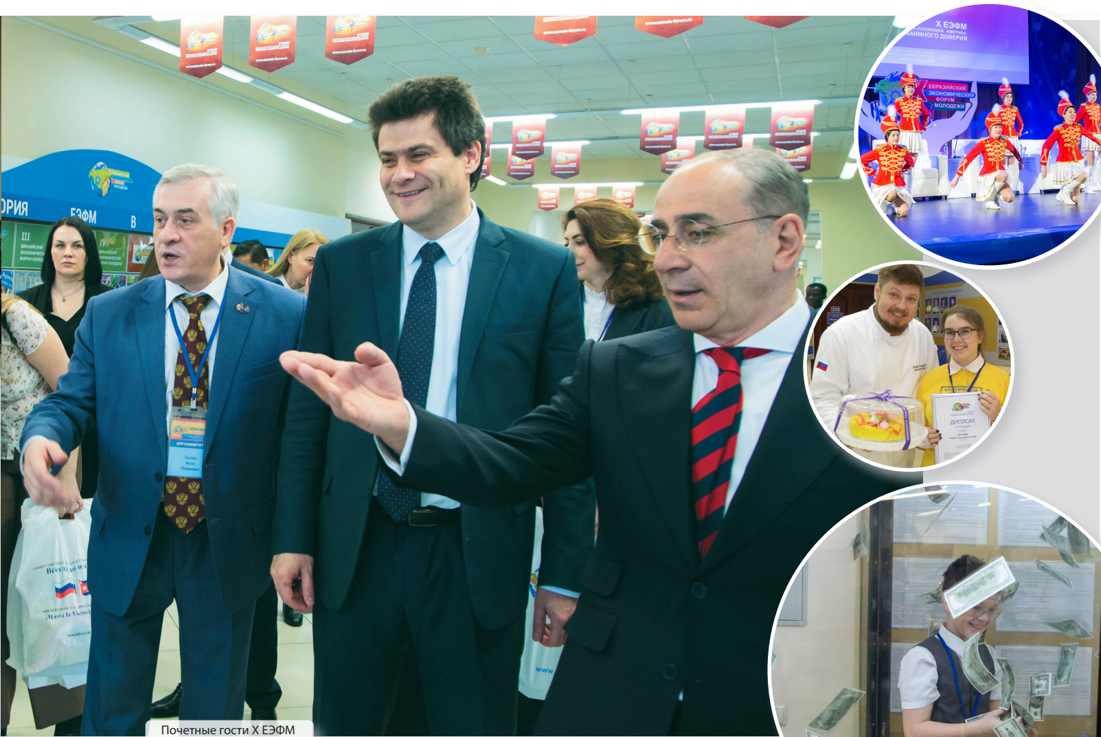
Почетные гости X ЕЭФМ