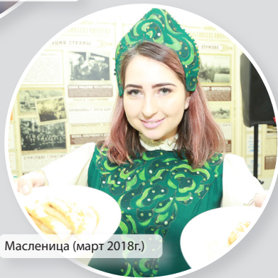
Масленица (март 2018г.)