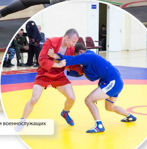
Чемпионат по самбо среди военнослужащих (август 2019 г.)