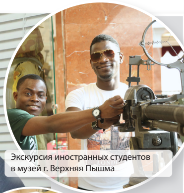
Экскурсия иностранных студентов в музей г. Верхняя Пышма