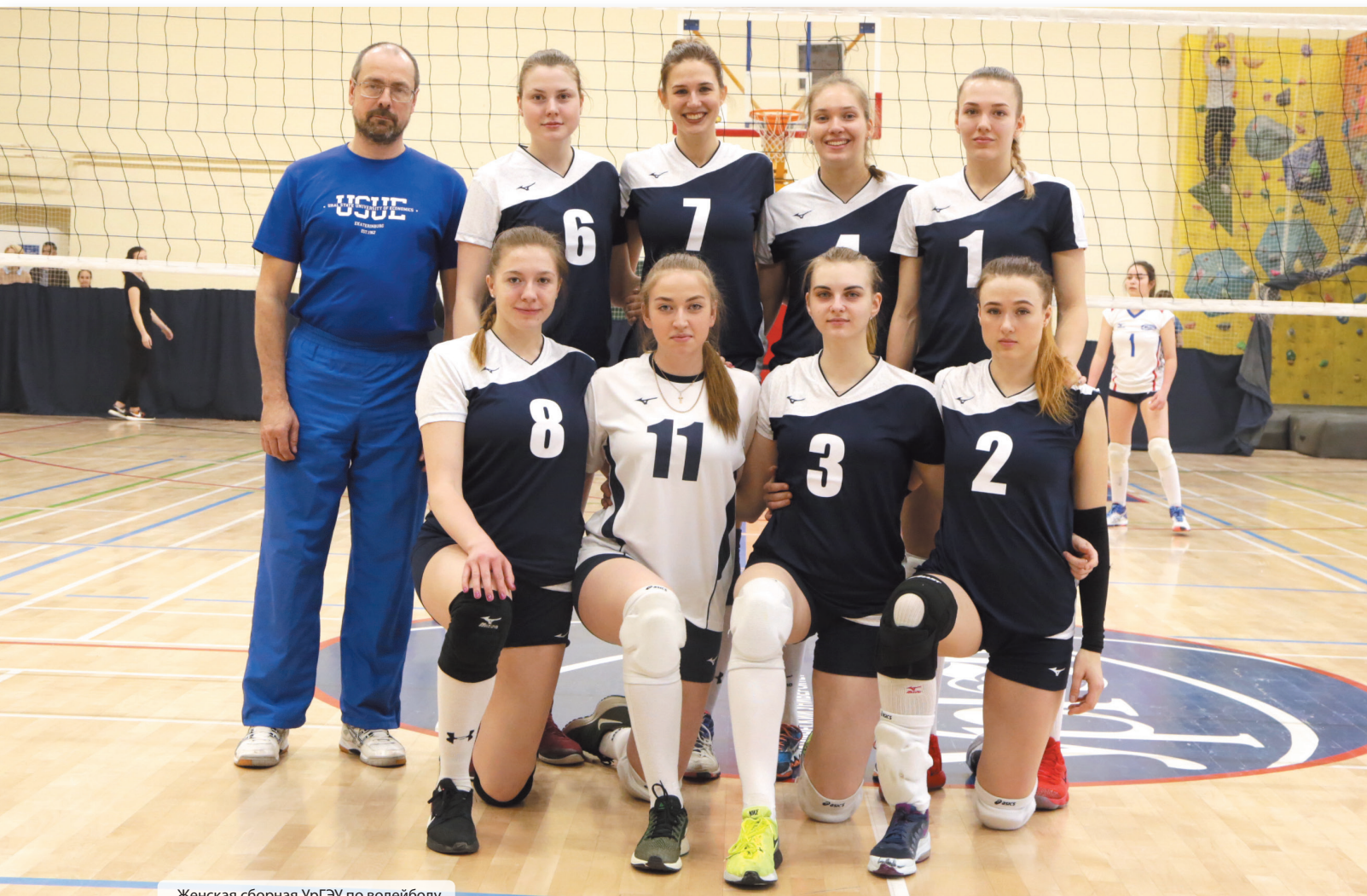
Женская сборная УрГЭУ по волейболу