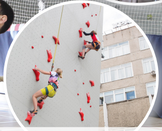
IX летняя спартакиада учащихся России по скалолазанию (июль 2019 г.)